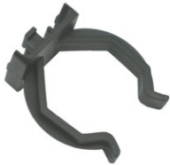
GRAMPA PARA PÉ OCTOGONAL / RODAPÉ EM PLÁSTICO