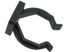
GRAMPA PARA PÉ OCTOGONAL / RODAPÉ EM MADEIRA