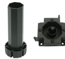
PÉ OCTOGONAL PARA LATERAL DE RODAPÉ