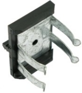
GRAMPA DE EMBUTIR 303 COM AFINAÇÃO