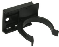
GRAMPA MILÃO COM AFINAÇÃO