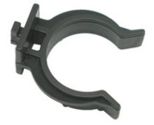
GRAMPA PLÁSTICA 151