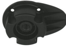
BASE OVAL DE APARAFUSAR