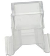
GRAMPA PARA PÉ OCTOGONAL