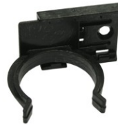
GRAMPA MILÃO COM AFINAÇÃO