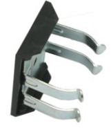
GRAMPA DE APARAFUSAR 141 COM AFINAÇÃO